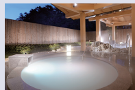
潮路亭 パールオーロラ風呂